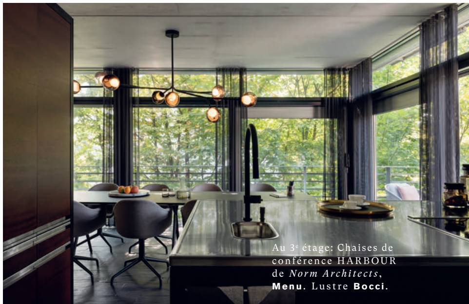
Au 3 e étage: Chaises de conférence HARBOUR de Norm Architects, Menu. Lustre Bocci.

Ce mandat combine les notions de « home office » et de « office home ». Autrement dit, le travail à domicile rencontre ici la tendance des bureaux « comme à la maison ».